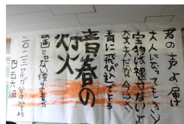
4,5,6組 書道パフォーマンス

10月25日には芹が谷小学校と芹が谷南小学校の6年生を迎え児童生徒交流日を開催しました。芹中生の楽しく生き生きとした姿に6年生が中学校入学に向けて希望をもってくれたことでしょう。