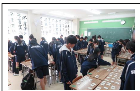
百人一首大会の一コマ

1, 2年生の皆さん、間もなく進級する時期です。ここでしっかりと今年度の自分を振り返り、次への成長につなげる期間としていきましょう。自分の良さと課題を前向きにとらえ、「認め合う心・高め合う心をもって」学習に、そして今年度最後の行事に取り組み、有意義な時間を過ごしていきましょう。