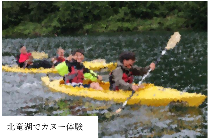
北竜湖でカヌー体験