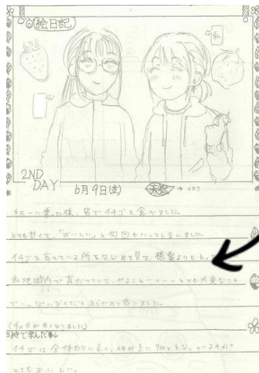
ある生徒の日記のページ

カヌーに乗った後、皆でイチゴを食べ ました。とても甘くて「おいしい」と 何回も言ってしまいました。イチゴを 育てている所をはじめて見て、想像よ りもとっても広い私有地内で育てて いて、やること一つひとつとても大切 なことでいっぱいなんだと改めて思 いました。