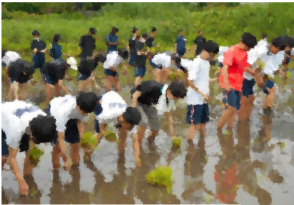
田植え～転んで泥だらけになる人も