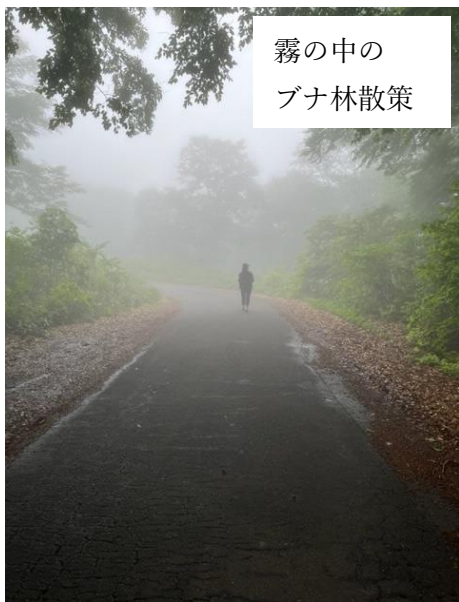
霧の中の ブナ林散策