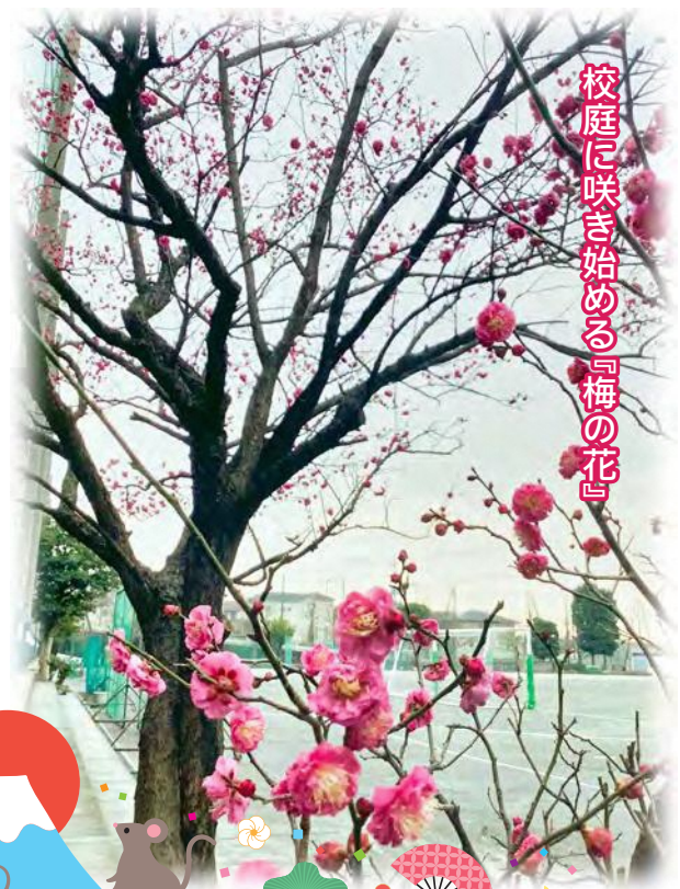
校庭に咲き始める『梅の花』