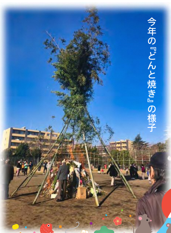
今年の『どんと焼き』の様子

次回、実行委員会は... 2月13日(休)10時~/南棟2階会議室(教職員室前廊下奥)にて行われます。