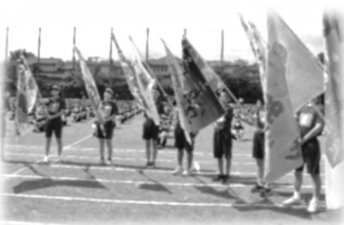
各学級で制作した学級旗