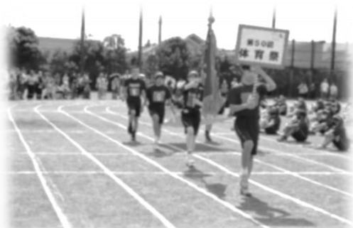
体育祭実行委員による行進