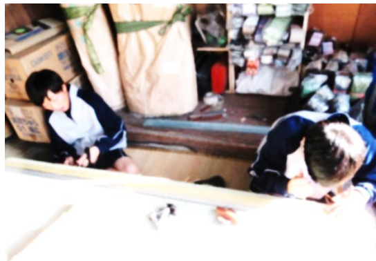
秋山畳店様にて畳の手縫い作業