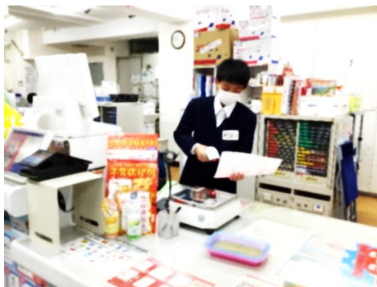
横浜上中里郵便局様にて商品読み取り作業