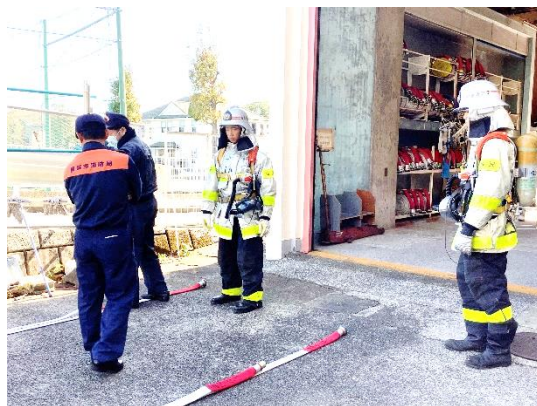
金沢消防署富岡出張所様にて放水訓練