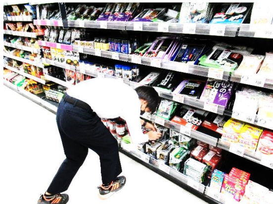
イオン金沢シーサイド店様にて商品陳列

2年次では、「職場体験学習」として市内の事業所様にご協力いただき、「はたらく」ということを体験させていただき、将来を見つめる大きなきっかけとなりました。この職場体験学習は、新型コロナウイルスの影響による3回の中止を経て、今年度4年振りに再開しています。今年度本校生徒を受け入れてくださった81事業所の皆様に感謝いたします。