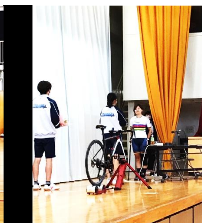
代表生徒からのお礼の言葉