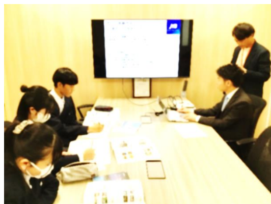
JTB 横浜支店様にて旅行プラン作り