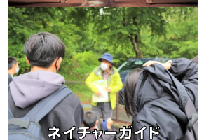
ネイチャーガイド