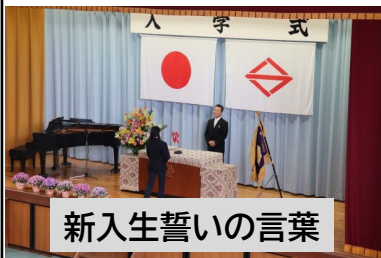
新入生誓いの言葉

4月7日（金）に令和5年度「入学式」を挙行了しました。今年度は137名の新入生を迎えました。