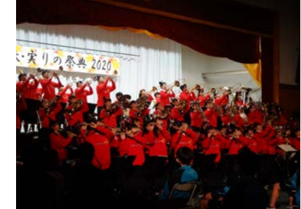
実り祭・合唱コンクール