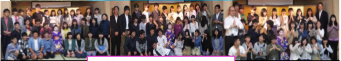
高雄観光ホテルにて ~舞妓さんと~

5月18日~20日実施の「奈良京都修学旅行」は、天候に恵まれて全行程を無事に終え、修学旅行実行委員会を中心として有意義な2泊3日間を過ごすことができるなど大成功を収めた校外学習となりました。