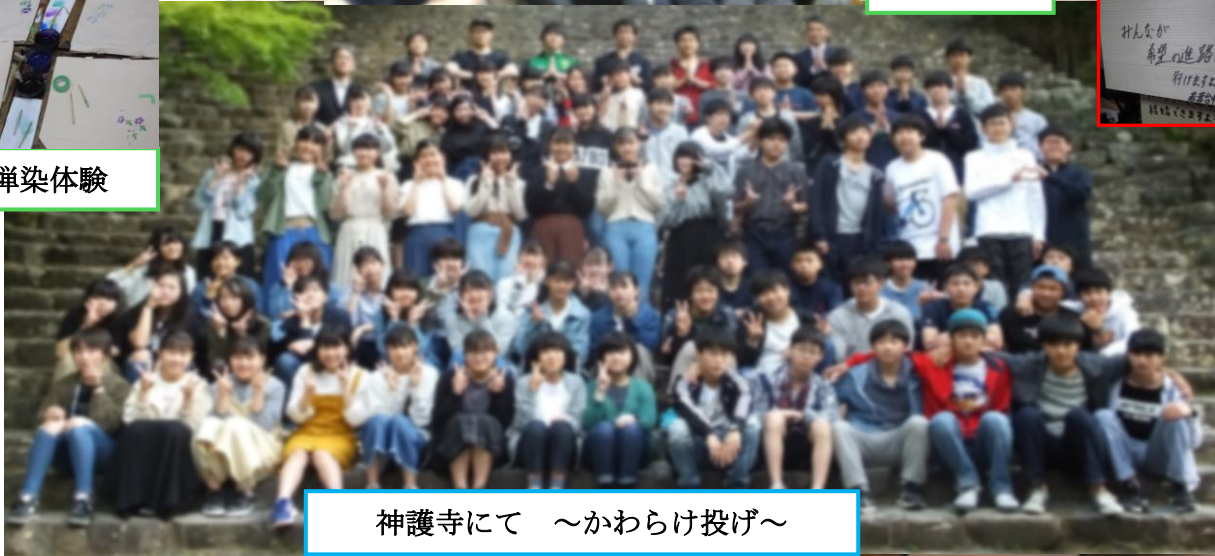
神護寺にて ~かわらけ投げ~