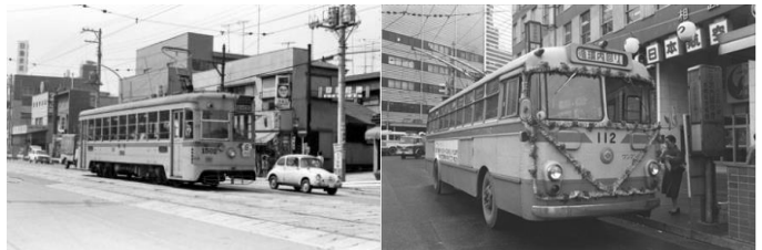
左)横浜市中区を走る市電。いわゆる路面電車。一緒に写る車も懐かしい。 右)起伏の多い横浜駅北部住宅街を一周するトロリーバス。道路の上に張られた架線から電氣を受け、動力として走る。

中止となったバザーですが、これまた多くの人の力により、準備したものを無駄なく処理することができ、制服リサイクル、フリーマーケットは27日の日曜参観で実施しました。ご協力をいただいた多くの皆様に、感謝いたします。来年こそは…。