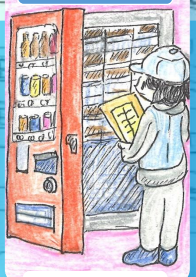
自動販売機の管理