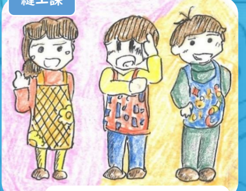
保育園受注製品制作 (園児エプロン等)