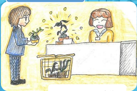
区役所コケ玉交換