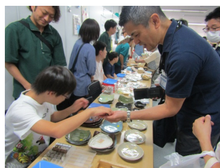
栄区長さんも買ってくれました。