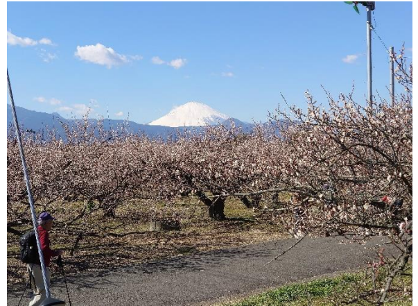
梅の花と富士山（曾我梅林 2024.2.12 撮影）

今年度も浦舟特別支援学校に温かいご支援、ご協力をいただいた保護者・地域の皆様には深く感謝を申し上げます。学校教育目標『 自他を大切にし、前向きに生きる力を育みます。 』をめざし教職員一同、これからも力を合わせ取り組んでまいります。今年度終わりにはあちこちに「別れ」が、そして来年度は新しい「出会い」があることと思いますが、皆様のご支援をいただけますようお願いしております。本当にありがとうございました。