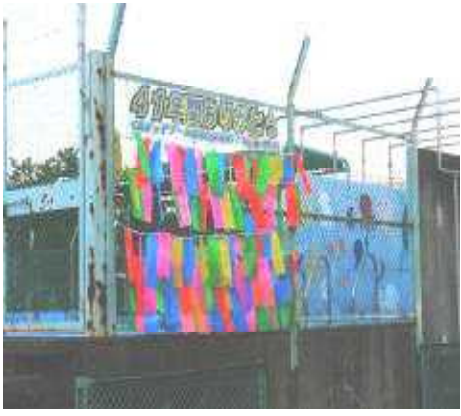
みんなで短冊を飾りました。

こんな風に、くぬぎ台小学校は地域や社会の安全を守るために陰ながらお手伝いをしてくれました。消防隊員のみならず、これからもよろしくをお願いします。