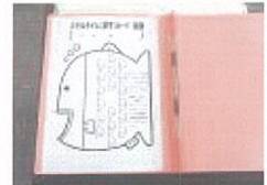
毎週末に、持ち帰るファイルです。