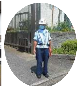
門で安全を守っていただきました