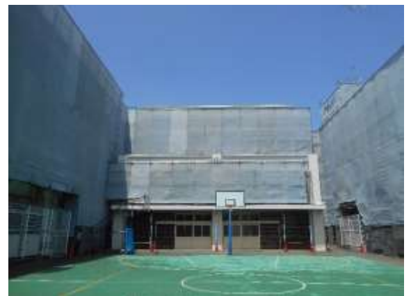
校舎の全てに足場がかけられました

今までは、窓の動きが悪く、鍵がかかりにくく開閉に苦戦していましたが、今はスイスイ動くようになりました。サッシの隙間がなくなり、雨漏りやすきま風の心配もなくなりました。快適に生活が送れるようになったことに感謝です。