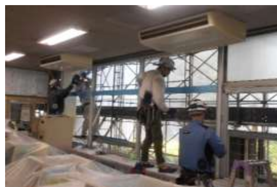
職員室も新サッシに交換