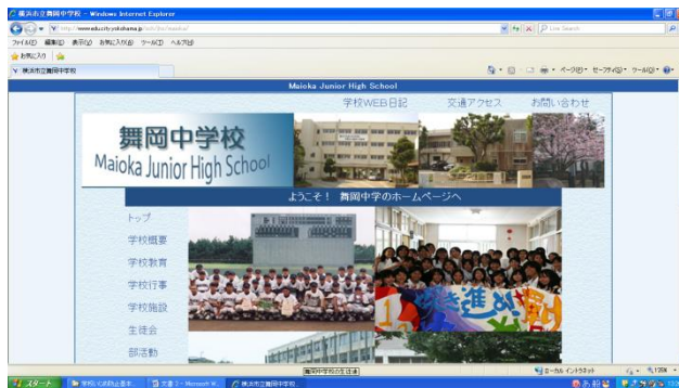
舞岡中学校ホームページ

P T Aの各種会議や保護者会等において、いじめの実態や指導方針などの情報を提供し、意見交換する場を設けます。また、いじめのもつ問題性や家庭教育の大切さなどを具体的に理解してもらうために、HP、学校・学年だより等による広報活動を積極的に行います。