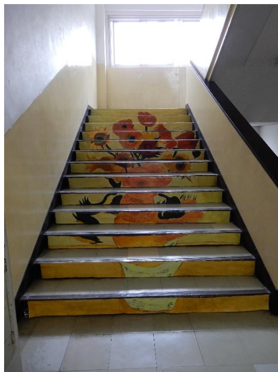
ゴッホ 「12本のひまわり」