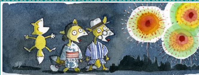
イラスト こみね さおり