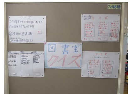
みんなで考えた図書室クイズ