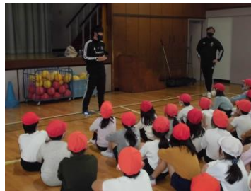
真剣にコーチの話を聞いています