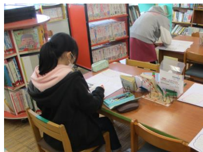
一生懸命準備しています!