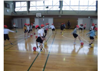
上手にボールを運んでいます