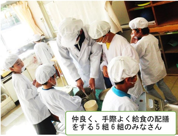
仲良く、手際よく給食の配膳をする5組6組のみなさん