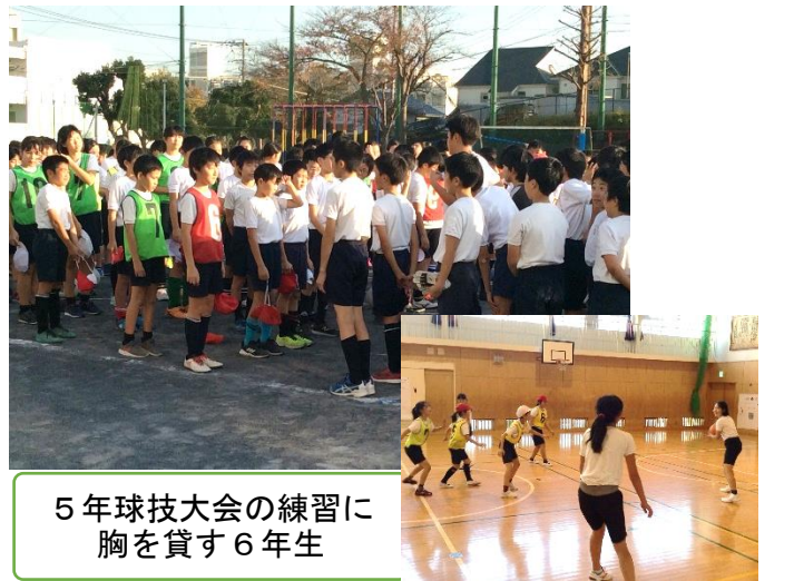
5年球技大会の練習に胸を貸す6年生