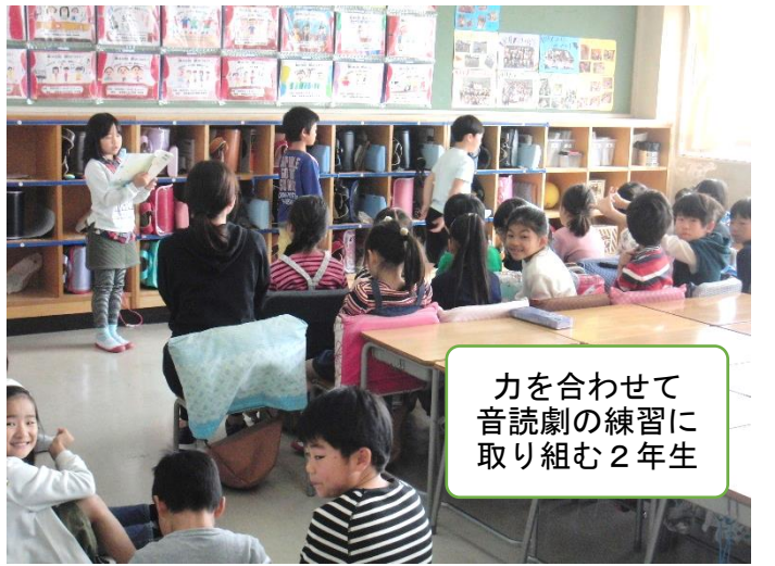
力を合わせて音読劇の練習に取り組む2年生