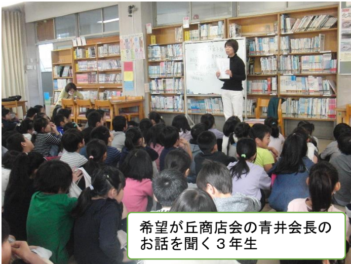
希望が丘商店会の青井会長のお話を聞く3年生