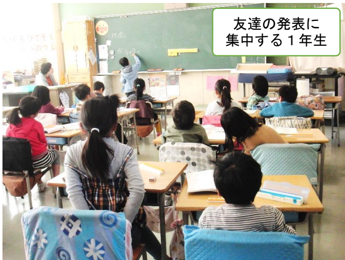
友達の発表に集中する1年生