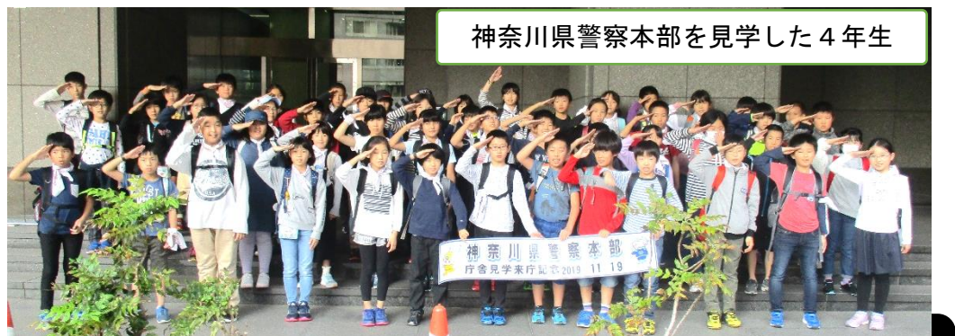
神奈川県警察本部を見学した4年生