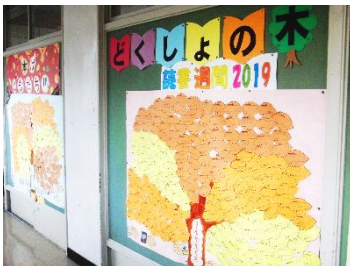
読書週間では、みんながおすすめする本を紹介する大きな「読書の木」が登場しました。