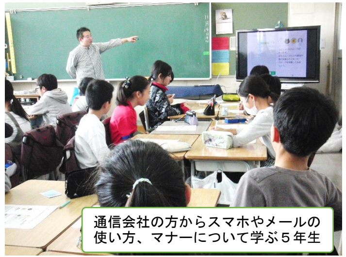
通信会社の方からスマホやメールの使い方、マナーについて学ぶ5年生