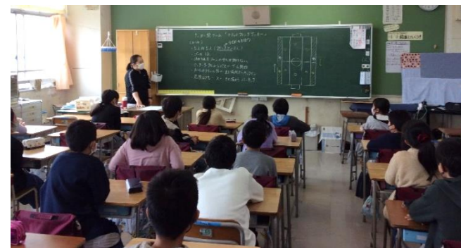
5年生の体育のボール運動では、子ども達同士の間隔が少なくなるようにルールを工夫して授業を進めています。そのため、教室でしっかりルールを共有してから授業をスタートさせました。