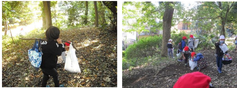
1年生は、生活科の秋の学習に使うどんぐりを拾いに、笹野台緑地へ出かけました。とてもたくさん拾って帰ってきました(上)。また、1・2年のなかよし班で、中希望が丘第5公園に出かけ、秋の公園で交流を楽しみました(下)。

11月は、学校の外へ出かける機会が増えました。感染予防をしながら、充実した学習活動が進んでいます。