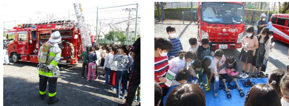
3年生は、消防の出前授業を行いました。消防車の装備を説明していただいたり、道具に触らせていただいたりしました。