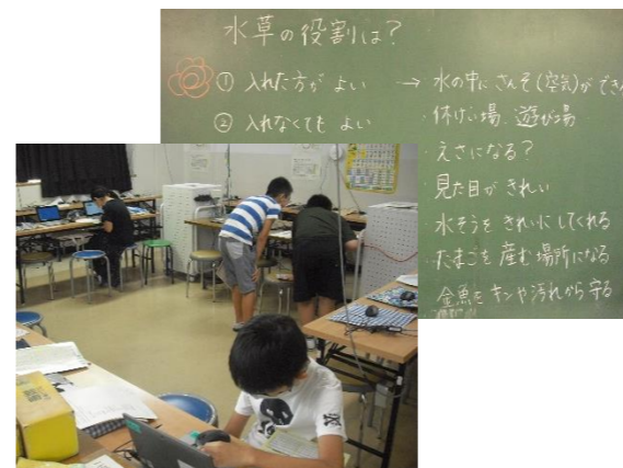
5・6組では、自分たちの力で金魚を飼うために、金魚について調べたり飼うために必要なものを考えたりしてきました。11月中旬に自分たちで買いに行く予定です。