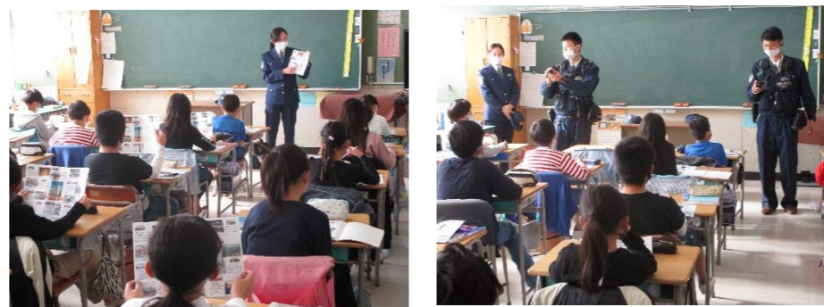
4年生は、県警本部の見学ができなくなった代わりに、県警の出前授業を受けました。旭区の派出所から警察官も来てくださいました。