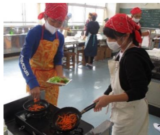
6年生の調理実習の様子です。野菜いためを一人ひとり作りました。学級の半分の人で、ガイドラインに基づいての授業です。緊張しながらも楽しく調理していました。