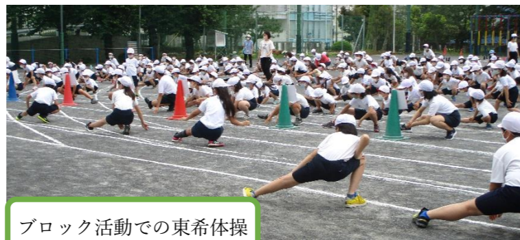
ブロック活動での東希体操