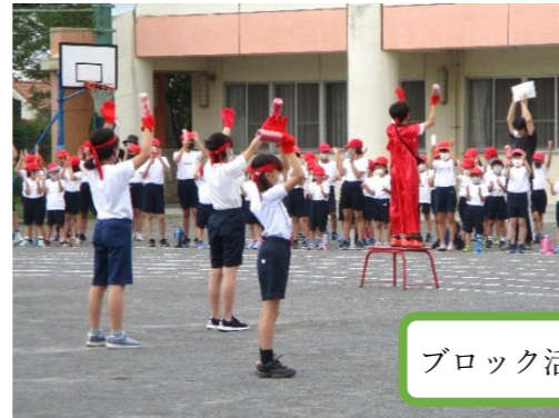
ブロック活動での応援練習