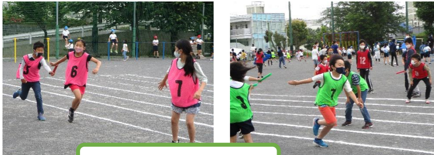
休み時間にリレーの自主練習