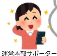
運営本部サポーター

個人のアカウントを教えずにいいから安心。出欠登録が簡単だし、自分の都合にあわせて応募できる。