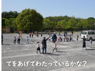
てをあげてわたっているかな?