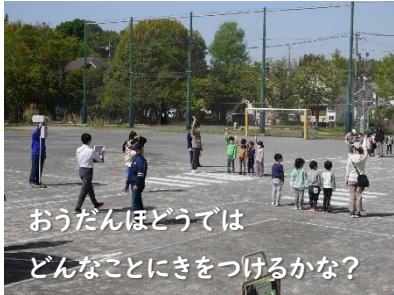
おうだんぼどうでは どんなことにきをつけるかな?