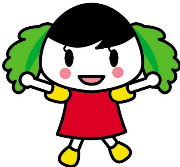
横浜市食育マスコット*バランスイ〜ナちゃん