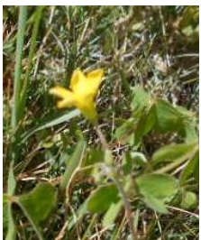
5 違う色のものもあります ○○○○