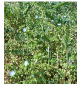
8 水色の小さな花です ○○○○○○○○○