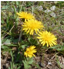
1 少し経つと、形や色が変わります ○○○○

花壇の中、畑の中、プランターの中、それらの周りなど、育てているものだけではありませんので頑張って調べてみてください。調べ方を考えることも学習です。困ったときは、家の人にも聞いてみてください。まずは、地面に咲いていた小さな花です。