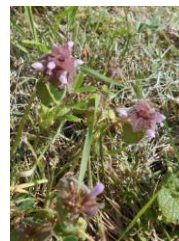
3 下の6と似ています ○○○○○○○○