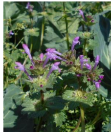
6 上の3と似ています ○○○○○○