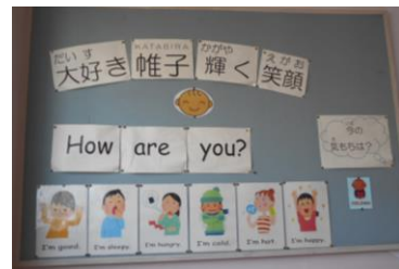
英語での挨拶が書かれています