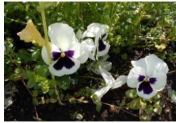
2 他にもいろいろな色があります ○○○○