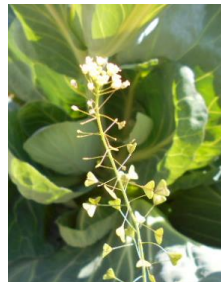
7 別の名前もあります ○○○