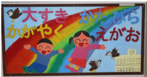
ずい分前の卒業生が作りました

学校の中のもの、掲示物を紹介します。2～6年生は、どこにあるか分かると思います。