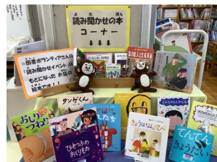
読んでいただいた本を展示するコーナー