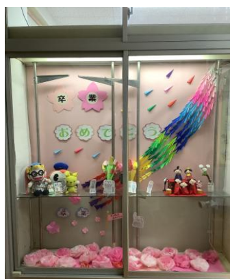
卒業祝いのステキな飾り