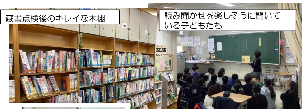
蔵書点検後のキレイな本棚

新規でご入会をお考えの方は、4月に改めてご案内させていただきます。次年度も楽しく充実した活動になりますよう、どうぞよろしくお願いいたします。