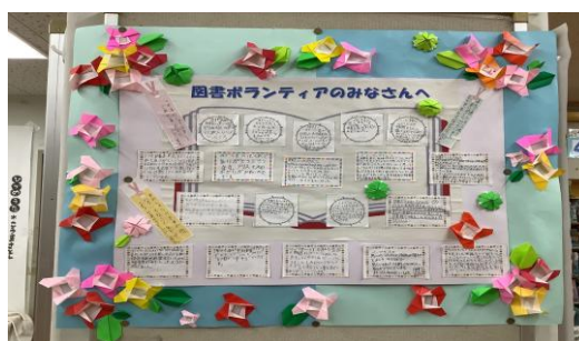
全児童を代表して委員会からの感謝のメッセージ