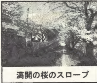
満開の桜のスロープ

http://www.edu.city.yokohama.jp/sch/es/nakawada/