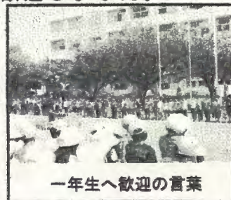
一年生へ歓迎の言葉

日ごろから子どもの心身の健康状態をよく把握し、日常的に親子の会話を絶やすことのないあたたかい家庭環境づくりこそが子どもの成長には欠かせません。