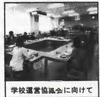
学校運営協議会に向けて

いよいよ卒業式、修了式に向けて子どもたちは動き始めます。お世話になった学援隊の皆様にもお礼の言葉、感謝の気持ちを伝えていきます。学んだ教室や廊下、階段等の清掃活動にも丁寧に取り組んでいます。「立つ鳥跡を濁さず」のことわざの通りにきちんと後始末をして中学校、次の学年へ飛び立ってほしいと願っています。