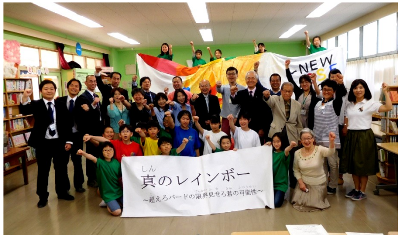
4/28(土) 学校運営協議会でテーマと思いを伝えました。

5月4日はみどりの日。法律によると、「自然にしたしむとともにその恩恵に感謝と、豊かな心をはぐくむ」ことを趣旨とする日です。みどり・本校にとっては、BSF運動委員会が来ているシャツの色です。BSFを盛り上げるために計画し、活動しています。なぜ、BSF運動委員がみどりなのか。真意のところはわかりませんが、BSF運動委員会の色としてはとても合った色だと思います。サッカーにはグリーンカードというものがあります。グリーンカードは、12歳以下のサッカーの試合で用いられます。けがをした選手に対して手を差し伸べるなどの良い行動をしていることを伝えるために審判が出すものです。BSFの時には、その精神がBSF実行委員にはあると思っています。そして、そのグリーンカードには、英語でDreamと書かれていて、その下に日本語で「夢があるから強くなる」と書かれています。BSFには必ず夢＝目標があります。その目標を達成させるために、みどりの軍団は結束して頑張っています。そんなみどりの軍団が今年もBSFの時にはたくさん見られると思います。いやあまり見られないかもしれませんが。目立つのは、赤・黄・青。みどりの軍団はどこかにいて、BSFを成功させるために動いていることでしょう。このみどりの軍団に支えられて、今年もBSFを盛り上げていきたいと思っています。