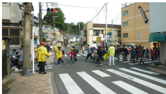
今年度もよろしくお願いします

(4月当初は、保護者や地域の方も立ってくださいました。)大雨の日、びしょびしょになりながらも立ってください、感謝の言葉しかありません。先日地域の方から、子どもたちが挨拶できるようになり、最近はこちらの方から挨拶してくれるようになったとのうれしい言葉を頂きました。あいさつは一朝一夕でできるようになるものではありません。毎日毎日の積み重ねがあって