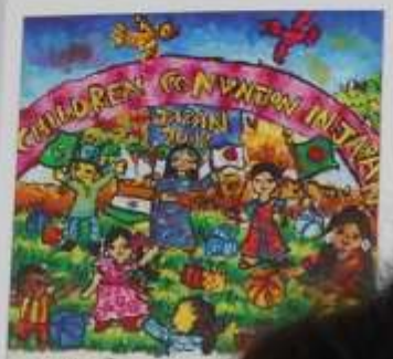
タマナスワイン (11歳) 12歳 インド

www.wwf.or.jp 2010年、WWFは、インドの "WWF" "WWF" "WWF" "WWF" "WWF" "WWF" "WWF" "WWF" "WWF" "WWF" "WWF" "WWF" "WWF" "WWF" "WWF" "WWF"