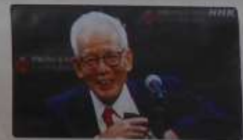
ノーベル物理学賞 まなべしゅくろう さん (90才)