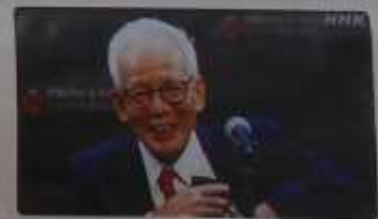
ノーベル物理学賞 まなべしゅくろう さん (90才)