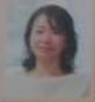
青年ボランティア ユニセフ・ガレッジ事務所 ボランティア 水泳選手

私は、ユニセフで働く前は、水泳の選手でした。子どものころ、水泳の国際大会をおして、たくさんの国の人と出会ったことがあって、世界で起きていることに興味をもつようになった。まずい国や紛争中の国の選手の名前は、サッカー(親しか知らない)泳ぎにゴールがずっとついていない選手もいて、生まれてから自分の国に負けたことが、自覚して、たくさん練習して、今はユニセフで世界の子どもたちのために仕事をしています。