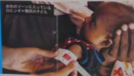
赤色のゾーンに入っている ロシヤ難民の子ども

「命のメジャー」(両寸大)の使い方を 写真のようにメジャーを上側に巻き、身体 の両側が指す数で子どもの栄養状態を把握 します。 赤色 ゴールデンメジャーの栄養不良 黄色 栄養不足 緑色 栄養不良の可能性は低い