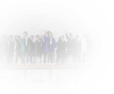
色別抽選会の様子