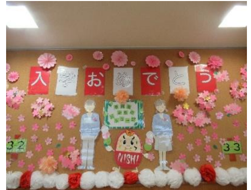
図書ボランティアさんによる掲示物

早いもので、入学・進級から1か月が経ちました。新入生の皆さんは、学校のどこに何があるか、教室や音楽室などの特別教室の場所はもう覚えられましたか？西中にきてみなさんはオープン図書館に驚きませんでしたか？とても開放的で、空間が広く感じられました。自由な雰囲気に満ちていますね。壁には図書ボランティアさんの掲示物があり、とても暖かな気持ちになりました。中央には NISHI だるまの姿も見えます。みなさんは NISHI だるまについて知っていますか？開校40周年記念のときに誕生したようです。生徒会新聞「青空」にも紹介が載っていました。引用させていただきます。