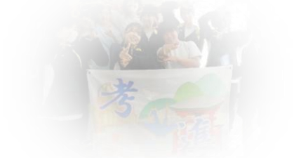
3年生スローガン旗作成中の実行委員会の皆さん