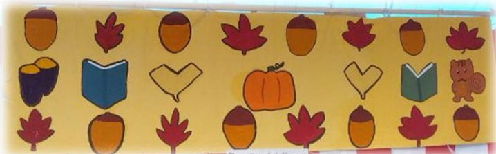
下和泉住宅のお祭りを彩った美術部の作品

職員室では、先生方が自分のクラスの合唱の様子について話をしています。20日の合唱コンクールは保護者の皆様もご観覧いただけます。お時間のある方はぜひ学校へ足をお運びください。