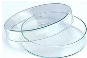
シャーレ(ペトリ皿)