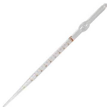
こまごめピペット