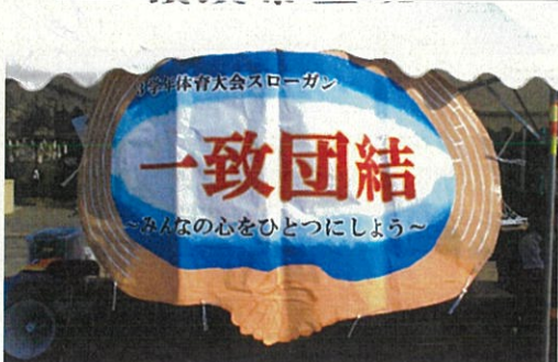
3年生体育大会スローガン

今年の体育大会は、3年生にとって最後の体育大会でした。その中で僕が一番印象に残った種目は、大縄跳びです。今回の体育大会では、唯一の団体種目でした。1組の最初の練習では全くまとまらず、10回くらいしか跳べず、とても優勝できるレベルではありませんでした。しかし、練習を重ねるにつれて全員で回数を数えたり、作戦を考えたり、チームを鼓舞する声が多く聞こえ、クラスの団結力が高まってきました。そして本番当日、全員で68回も跳び、優勝することができました。今回の体育大会では、総合優勝することはできませんでしたが、クラスが一致団結し、全員が楽しめる体育大会にすることができてよかったです。