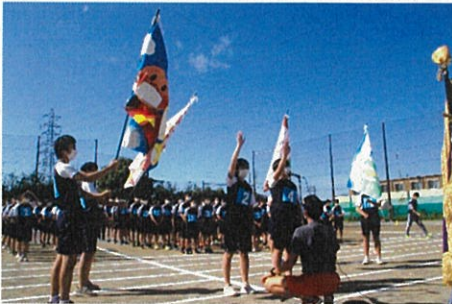
3年生選手宣誓（10/16午後）

コロナ禍、体育大会の実施については、何度も教職員で検討を繰り返した結果、感染予防を鑑み、密にならないよう規模を縮小して学年別の実施、そして種目を厳選、生徒と教職員のみで平日開催の形を決定して進めてきました。保護者の皆様やご来賓の皆様及び地域の方々にもご理解いただき、2日間にわたり、本年度の体育大会を実施することができました。