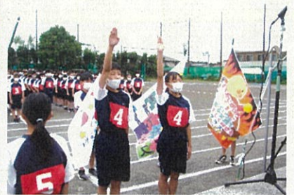
1年生選手宣誓（10/16午前）

生徒の皆さんは、体育大会実行委員会を中心に誰も体験したことのない新しい形の体育大会の準備を進めてきました。夏休み明けの9月の全校朝会（校内テレビ放送）では、全体スローガンと学年別スローガン（美術部制作）を発表し、廊下に掲示すると、生徒の皆さんの気持ちを一気に盛り上げていってくれたように感じました。言葉の力、そして、絵の表現力に心を動かされ、例年以上に体育大会当日を待ち望む生徒の様子が校内にありました。