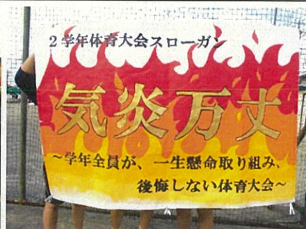
2年生体育大会スローガン