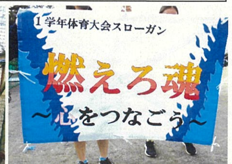
1年生体育大会スローガン