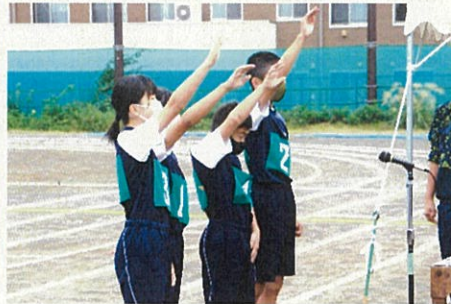
2年生選手宣誓（10/15午前）