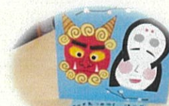
節分の飾り物（職員玄関に展示） （齊藤真知子教諭作）

今年度も残り2カ月。1、2年生は次年度に向けて、そして、3年生は卒業に向けて、いよいよラストスパートの時期に入ろうとしています。最後まであきらめず、頑張りぬくことを生徒の皆さんに期待しています。