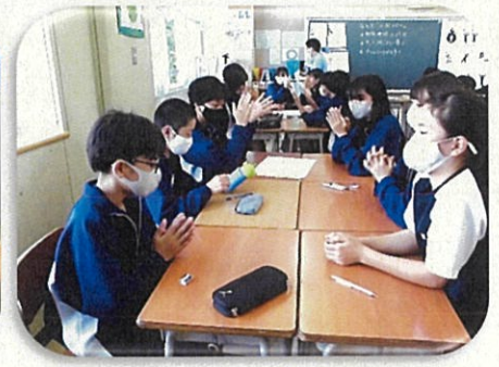
▲縦割活動後の振り返りの時間。気付いたことや感想を伝え合うと、自然と拍手！