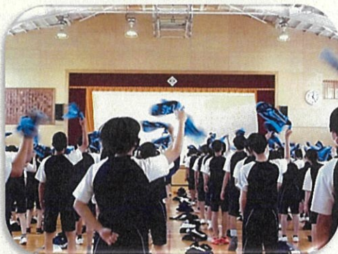
▲体育館でタオルを活用した応援練習

いよいよ7月、2回の色別活動で応援練習や仲間作り（GWT：グループワークトレーニング）を進めました。