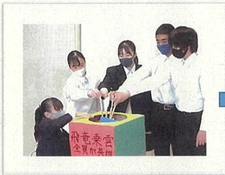
▲体育大会実行委員会による色別抽選会