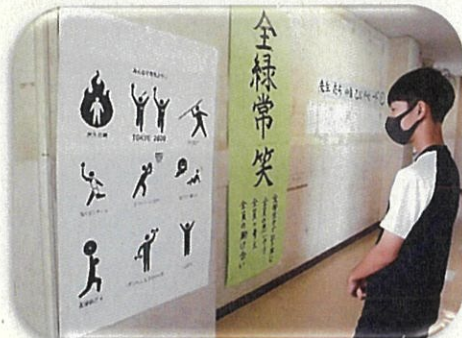
▲廊下のイラストを確認して、教室の班の仲間に言葉で伝えてイラストを再現！1～3年の生徒が1つの班で力を合わせた縦割活動のGWTでした。