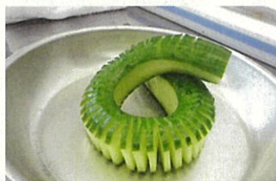
▲じゃばら切り（講師見本）

7月8日(木)、岩谷学園のご協力のもと、講師の方に来校していただき、2年生を対象とした職業体験学習を行いました。昨年度の職業体験学習は、緊急事態宣言期間中と重なってしまったため、残念ながら中止とせざるを得ませんでした。