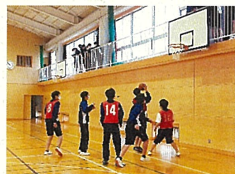
▲バスケットボール (2年)