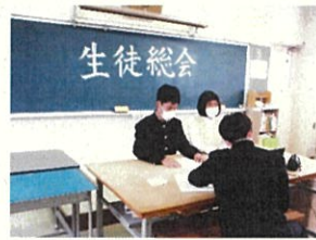
▲「生徒総会」は議長進行