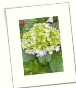
うす紫のアジサイが咲きました

なお、感染予防に関しましては、先日お配りしたお知らせの通り、暑い夏の時期はこれまでの感染予防策をとりつつも、命に係わる熱中症対策を優先することになりました。学校では、横浜市が新たに示した「衛生管理マニュアル」に基づいて教育活動を進めてまいります。まず、体育の授業や部活動などの運動時はマスクを外すよう教員から声を掛けます。登下校時も熱中症が心配される時はマスクを外してよいことを担任から指示しました。長いマスク生活で、マスクを外すこと自体に抵抗感がある生徒もいるかもしれませんので、決して強制するものではありません。しかしながら、暑くなるにつれ校内外でマスクを外す生徒の姿が増えてくると思います。ご家庭・地域の皆様のご理解ご協力をよろしくお願いいたします。