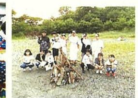
▲キャンプファイヤー準備