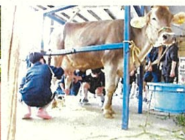
▲酪農体験(搾乳場面)