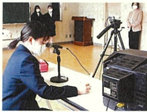
▲生徒会長進行の「生徒朝会」

委員会活動や係活動など、学級組織が決まり、生徒会主催で「生徒朝会」や「生徒総会」を次々と開催しています。「生徒朝会」は放送室からリモート配信で、入学したばかりと思っていた1年生も放送委員として活躍しています。5/20の「生徒総会」は、生徒全員が標準服で臨みました。総会会場の端末3台（議長用・答弁用・確認用）と各教室の端末をGoogle Meetで繋ぎ、それぞれの場所で質問や答弁ができました。Google Meetの画面調整は、生徒会役員や放送委員長がテキパキと対応し、4月に開催した集会の経験を存分に生かしている姿が見られました。各委員会の計画はいよいよ実行です。