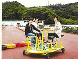
▲おもしろ自転車体験