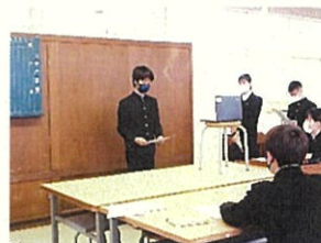
▲Google Meet で答弁