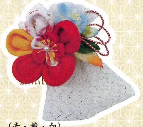
④花びら (赤・黄・白)