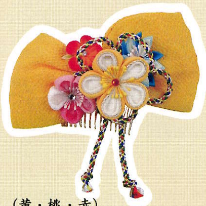
③花びら (黄・桃・赤)