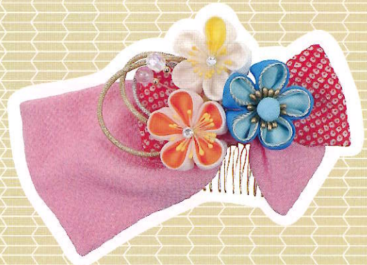
②花びら (青・白・橙)