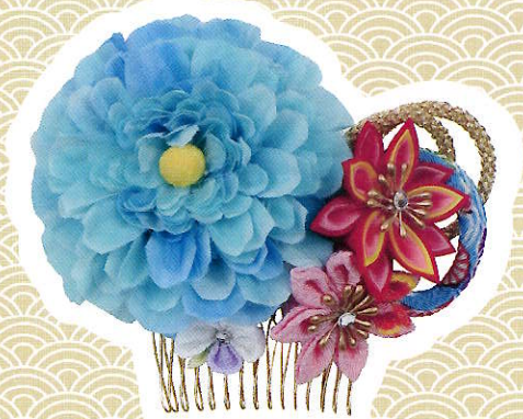
①花びら (青・赤・桃)