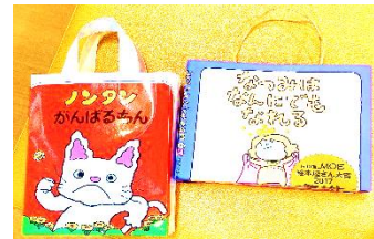
←本のカバーでつくったバッグ