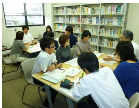
ワークショップ (グループ)