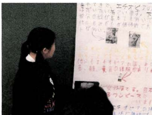
エチオピアの歴史や衣装、食べ物などについてグループごとに調べたことを発表しました。