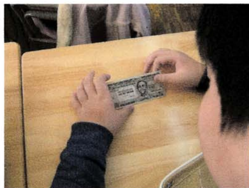
協力隊の講師の方からエチオピアの紙幣を実際に見せていただきました。子どもたちは興味深く手にとって見つめていました。